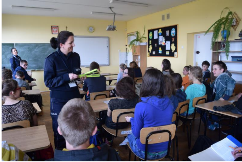
Uczniowie klasy II i III Gimnazjum