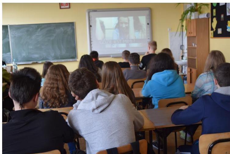
Uczniowie klasy I Gimnazjum

Na zakończenie spotkania uczniowie mogli zadawać pytania na nurtujące ich tematy. Byli zainteresowani głównie konsekwencjami prowadzenia pojazdów pod wpływem alkoholu i jazdy skuterem bez karty motorowerowej.