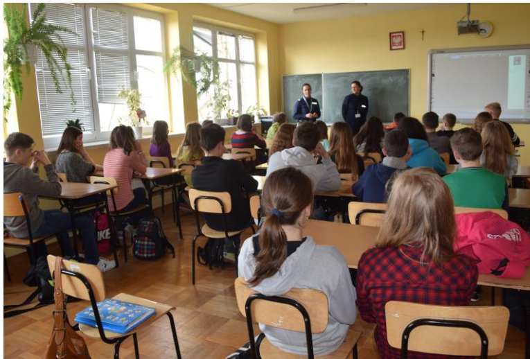
Uczniowie klasy I Gimnazjum

Punktem wyjścia spotkań było pytanie: za co można odpowiadać karnie? Uczniowie wykazali się dużą znajomością w tym zakresie i udzielili wielu odpowiedzi. Podsumowując, jedna z pań policjantek przytoczyła kilka przykładów kar przewidzianych dla osób nieletnich za przejawy demoralizacji, używanie wulgaryzmów w miejscach publicznych, niekulturalne zachowanie podczas masowych imprez sportowych. Uczniowie otrzymali, także lekturę do przeczytania – ulotki zawierające opis wizerunku pseudokibica oraz konsekwencje zachowań agresywnych przewidziane w Kodeksie Karnym dla tzw. kiboli.