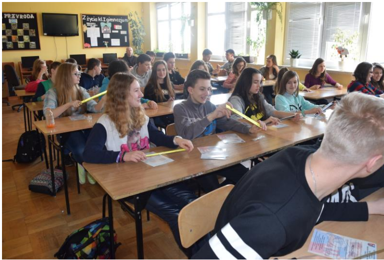
Uczniowie klasy I Gimnazjum